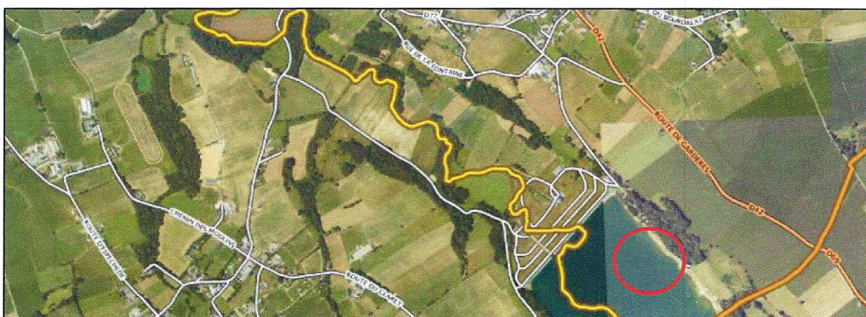
Localisation du site

Le projet touristique de déplacement du camping prévu dans le PLU a évolué. Si le camping municipal situé dans le bourg a fermé, il n'est plus question de le déplacer aux abords du lac de Gabas. Il s'agit aujourd'hui de permettre l'implantation d'un PRL et de structures hôtelières. Ce projet s'inscrit dans le cadre du projet d'aménagement et de valorisation du lac de Gabas de la Communauté de Communes du Pays de Morlaàs. Le secteur concerné est situé en interface entre le village d'Eslourenties-Daban, le barrage et le lac de Gabas.