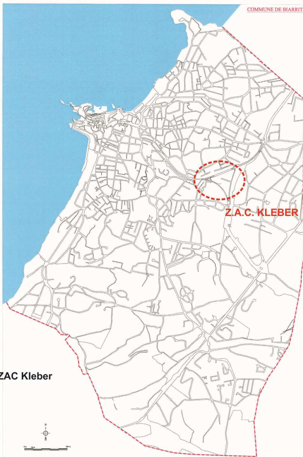
Situation de la ZAC Kleber